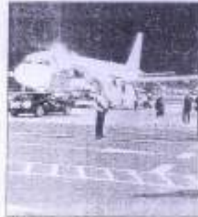
বিতর্ক: ভুমকি পরে দুইটিয়ে যায় নিউজিল্যান্ড দল। আইন উদ্বৃত্ত