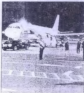
বিতর্ক: হুমকির পরে দুবাইয়ে যায় নিউজিল্যান্ড দল। ফাইল চিত্র

পাক তথ্যমন্ত্রীর দাবি, তাঁদের তদন্তকারীরা জানতে পেরেছেন, যে যন্ত্রটির সাহায্যে হুমকি দিয়ে ইমেল পাঠানো হয়েছিল, তা ভারতের সঙ্গে যুক্ত ছিল। “একটি ভার্সিয়াল প্রাইভেট নেটওয়ার্কের (ভিপিএন) মাধ্যমে এই ইমেল পাঠানো হয়। লোকেশন দেখানো হয় সিঙ্গাপুর। কিন্তু একই বছরের ১৩টি আলাদা আইডি ছিল, যার প্রত্যেকটির ছিল ভারতীয় নাম। যে যন্ত্রের মাধ্যমে হুমকি দিয়ে ইমেল পাঠানো হয়েছিল, তা ভারতেরই ছিল,” মন্তব্য পাক মন্ত্রীর। তিনি স্পষ্ট